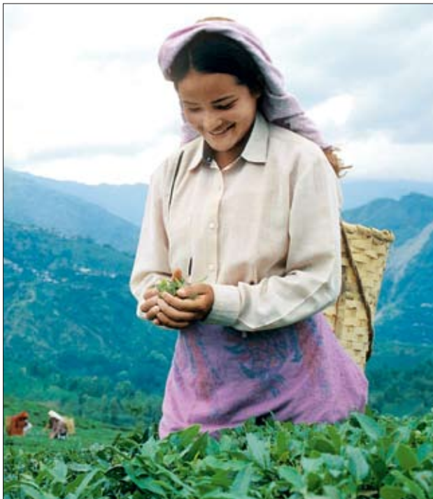
Eine Teeplückerin in Ambootia (Darjeeling) A tea picker in Ambootia (Darjeeling)

Together with our investors, we help to make the world a slightly better place. Our investments are aimed at improving working, training and schooling conditions as well as facilitating the transition to ecological agriculture. The resulting enhanced market position safeguards the future of thousands of people and their children in Darjeeling. We combine ethics and ecology with economics – for a term of only 8 years and on a no-load basis, our investors receive a dividend of 7% per annum. You need no more than € 5000 to participate. Ask your investment adviser or consult our website at www.simplyfairinvest.com .