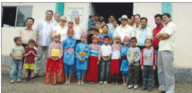
Die Grundschulklasse des Ambootia Teegartens The primary school class of the Ambootia tea garden

Informationsstand während des Kongresses im Foyer