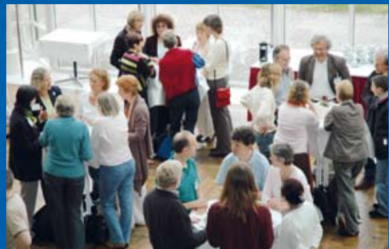
World Café: Conference „Kollektive Intelligenz“ 2006

At the coffee-tables the dialogue is about our experiences with others, strangers: our curiosity, uncertainty, surprise, fear, anger or joy, and perhaps even a most unexpected turnaround. While changing the coffee-tables three times, we go through meeting the other participants, new acquaintances and strangers, coming ever closer to the heart and the soul of what “Identities” is all about on a very practical level.